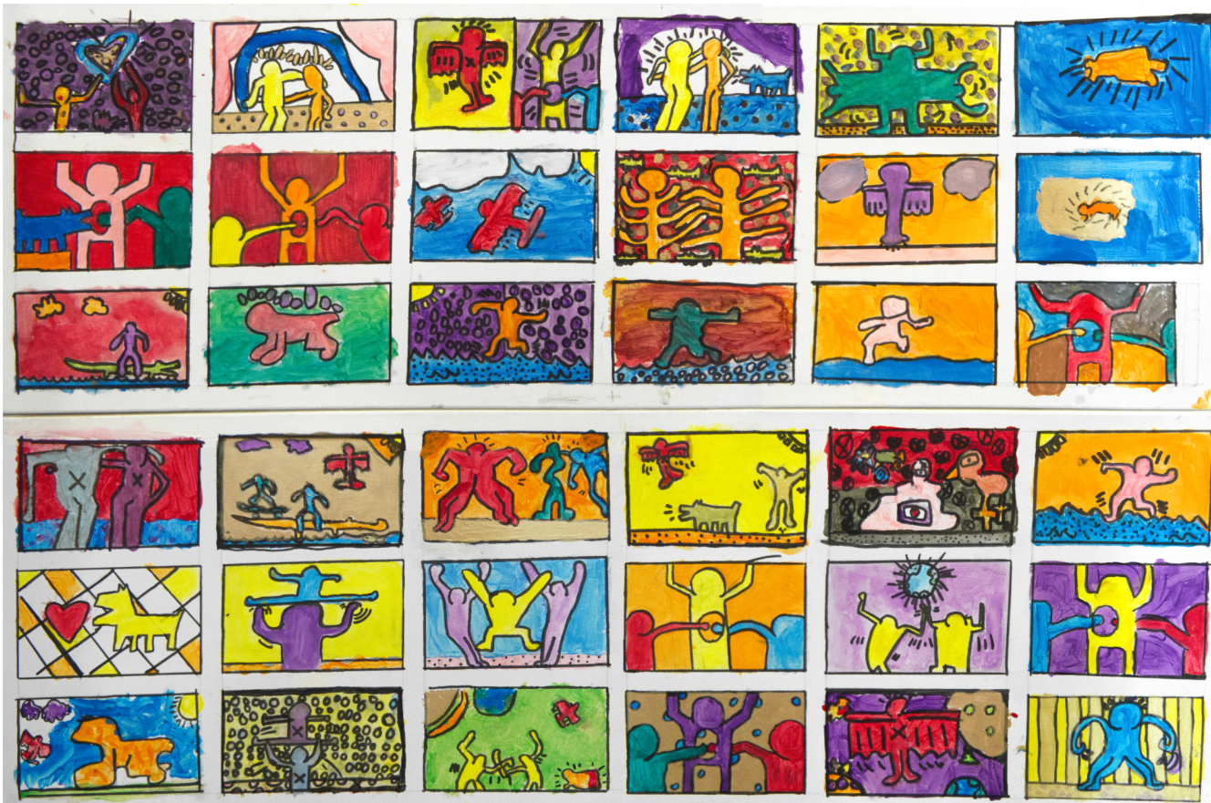
Groep 6 (de huidige groep 8) van OBS Voordorp maakte deze prachtige panelen tijdens een project over Keith Haring voor Voordorps Verbeelding in 2024. Ieder kind mocht een tekening maken in de stijl van Keith Haring.