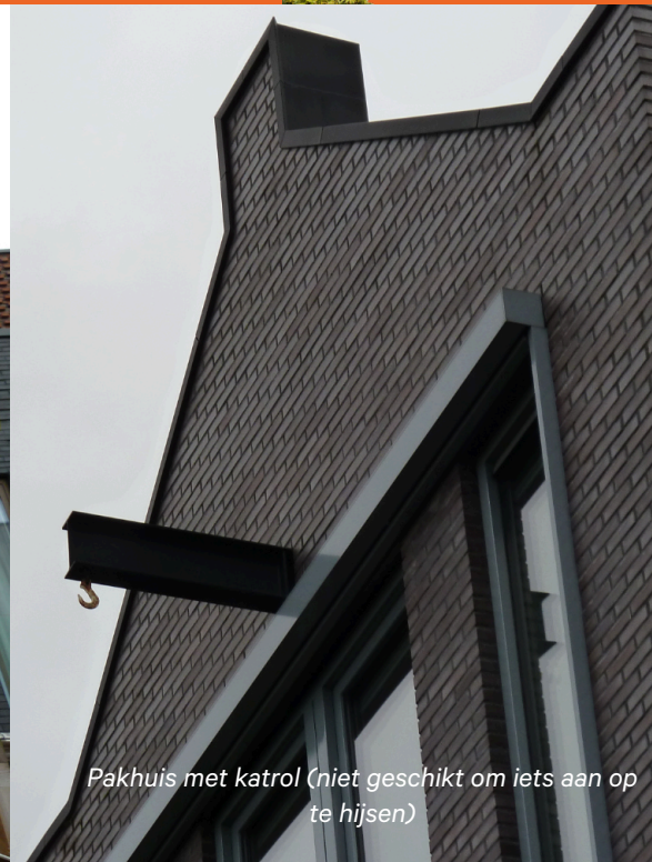
Pakhuis met katrol (niet geschikt om iets aan op te hijsen)