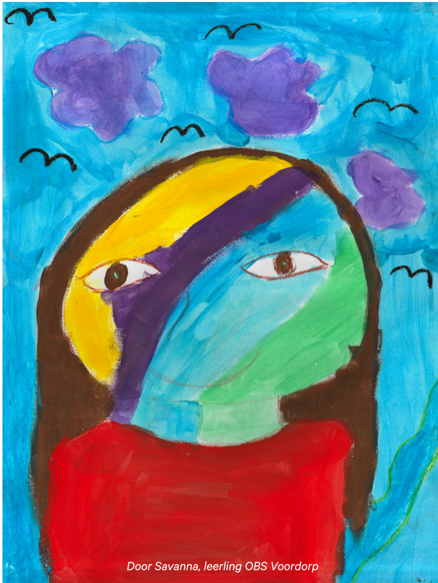
Door Savanna, leerling OBS Voordorp