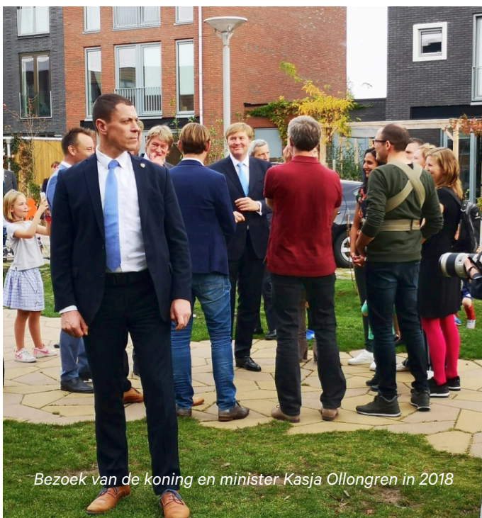
Bezoek van de koning en minister Kasja Ollongren in 2018

We hebben allemaal wel onze draai gevonden hier. Doordat het zo klein is en we veel praktische dingen delen, is het eigen geworden en hebben we binding met elkaar. Het valt echt op als er nieuwe bewoners zijn en die worden, jonger en ouder, warm verwelkomd.