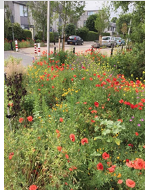
Entreprijs van de wijk Voordorp.