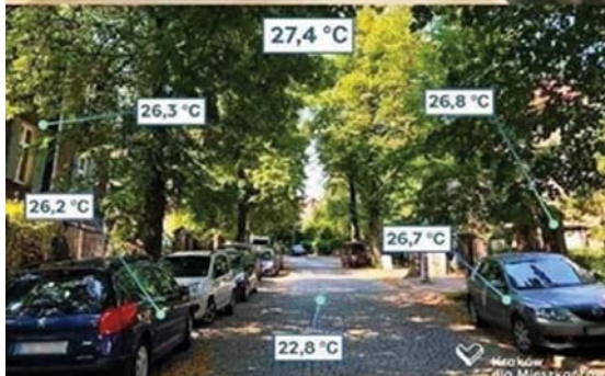
Temperatuur op verschillende plaatsen in een stad op zelfde tijd.